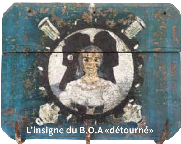
L'insigne du B.O.A «détourné»

*En 1939, nous avions un B.O.A. dans le village, une compagnie entière !