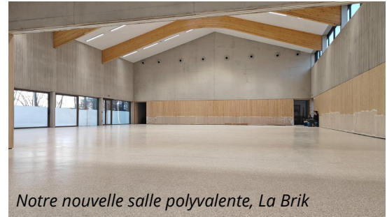
Notre nouvelle salle polyvalente, La Brik