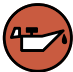
Huile de vidange