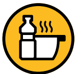
Huile de friture