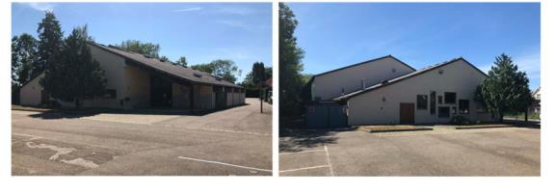
RENOVATION DE LA SALLE POLYVALENTE ET CREATION D'UN PERISCOLAIRE DE 60 PLACES

Comme vous le savez, la rénovation de notre salle polyvalente construite en 1978, qui arrive à bout de souffle, et la construction d'un périscolaire de 60 places pour nos enfants constituent les projets phares de la mandature actuelle et nous y travaillons d'arrache-pied depuis notre entrée en fonction en mai dernier. Après prise en compte des exigences réglementaires de tous ordres, des prescriptions d'urbanisme du PLUI, des contraintes liées à l'implantation des réseaux actuels, il a été procédé à un état complet des usages actuels de la salle polyvalente. Cet état a été complété par une consultation des associations du village concernant leur utilisation concrète de la salle polyvalente et de leurs attentes. Il a également été